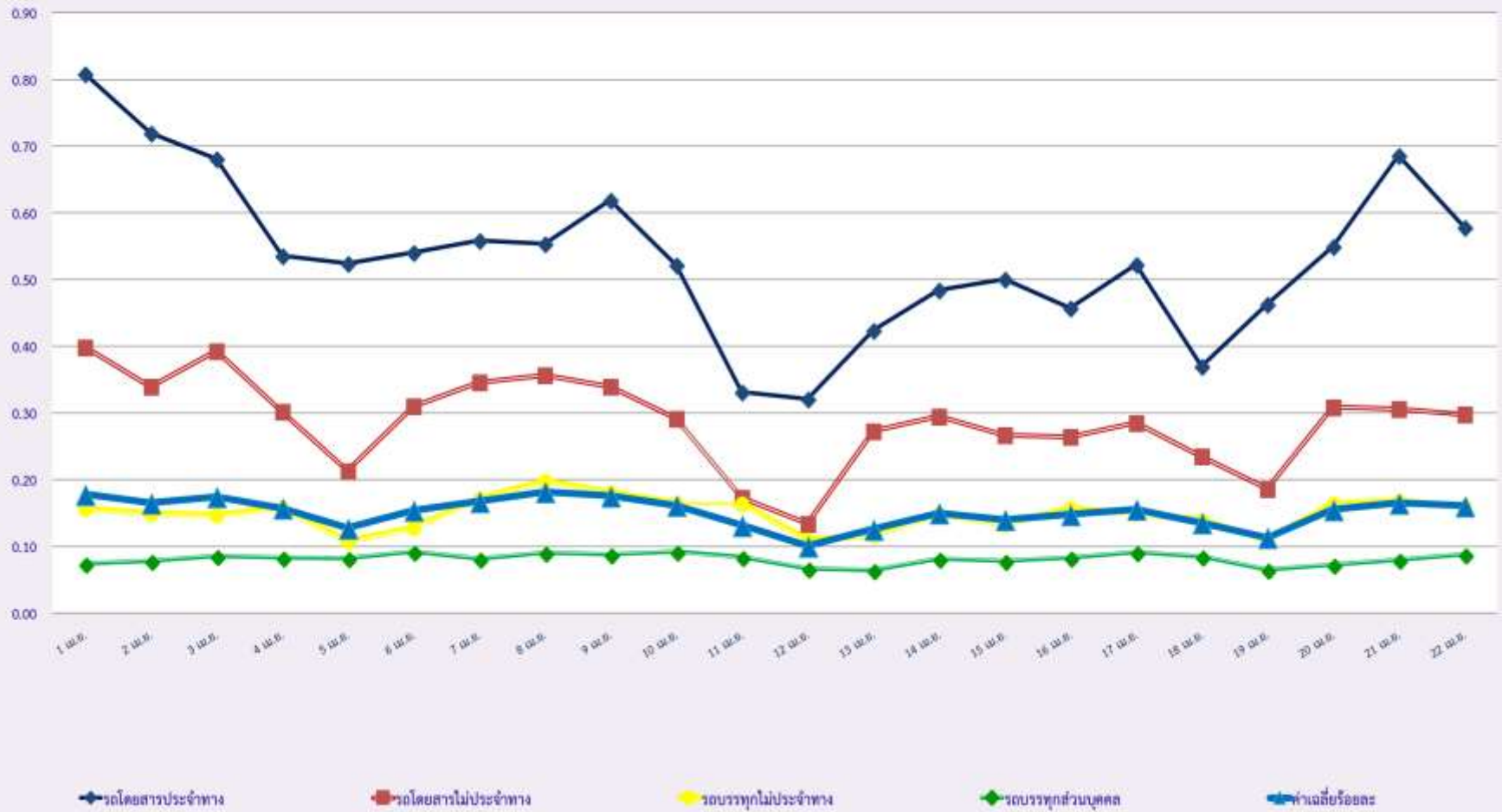
สถิติรถที่มีความเร็วเกินในรถแต่ละประเภท (ร้อยละ)